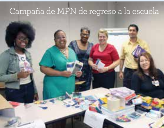
Campaña de MPN de regreso a la escuela

La Oficina de Diversidad e Inclusión de CHOP renovó su auspicio de Young Heroes Club a la escuela primaria Joseph Pennell . Mediante el club, un programa del Museo Nacional Liberty, los empleados que son voluntarios enseñan habilidades de liderazgo mientras ayudan a los jóvenes a abordar cuestiones comunitarias claves. Los niños aprendieron a investigar, a comunicarse con quienes toman decisiones y a compartir lo aprendido en forma oral y escrita. El club Pennell, con 56 niños, organizó en la escuela un evento comunitario contra el acoso infantil Stamp Out Bullying y presentó información a más de 200 compañeros.