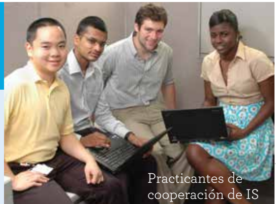
Practicantes de cooperación de IS

CHOP apoyó la misión de la West Philadelphia Skills Initiative , del distrito de la ciudad universitaria, que se esfuerza por conectar a los empleadores del área que buscan talentos con los habitantes del oeste de Filadelfia que buscan