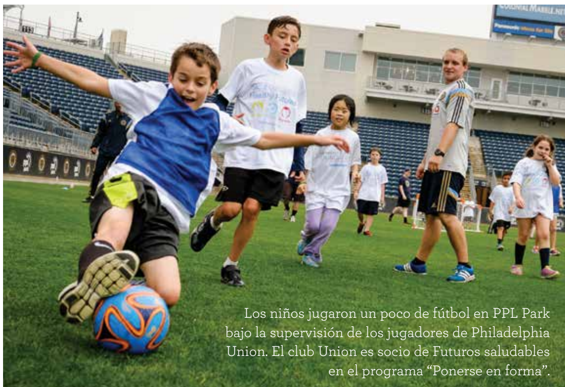
Los niños jugaron un poco de fútbol en PPL Park bajo la supervisión de los jugadores de Philadelphia Union. El club Union es socio de Futuros saludables en el programa “Ponerse en forma”.